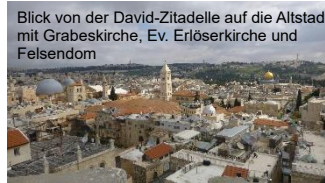
Blick von der David-Zitadelle auf die Altstadt mit Grabeskirche, Ev. Erlöserkirche und Felsendom

10. Tag, Samstag, 29.4.23 Besuch in der Altstadt, David Zitadelle-Geschichte des Landes und der Stadt von Anfang an. Stadtmauer, Westmauer, Shuk, Freie Zeit.