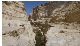
der herrlichen Schlucht.