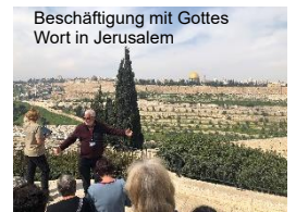
Beschäftigung mit Gottes Wort in Jerusalem

10. Tag, Samstag, 29.4.23 Besuch in der Altstadt, David Zitadelle-Geschichte des Landes und der Stadt von Anfang an. Stadtmauer, Westmauer, Shuk, Freie Zeit.