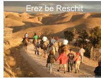
Erez be Reschit

Besichtigung der Festung Massada (wahlweise Auffahrt Gondel oder zu Fuß „Schlangenpfad“), Fahrt nach Qumran u. Besichtigung, Fahrt n. Jerusalem